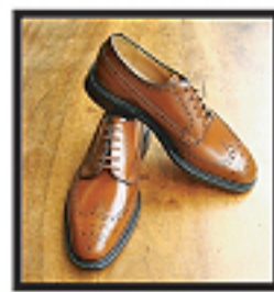
#173 GRAFTON ウィズ F