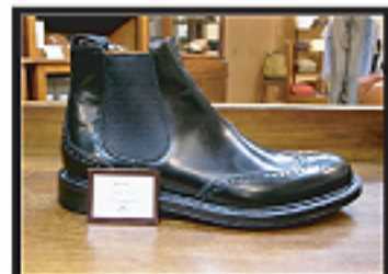
#103 Kelby ウィズF

植物の名を冠した定番モデル 「シャノン」に使用されている事で 広く知られている LAST ボリュームのある顔つきながらも スマートな雰囲気をもっている