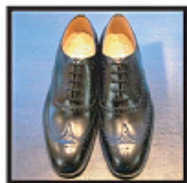
#173 DIPLOMAT ウィズ F

バランスの良いトゥが特徴で クラシックなスタイル。 定番として使用されていた#73の トゥシェイプを受け継ぎ、更に 進化させた新定番 LAST