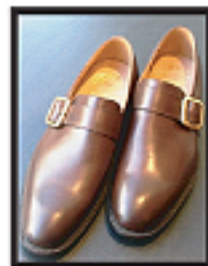
#173 WESTBURY ウィズ F