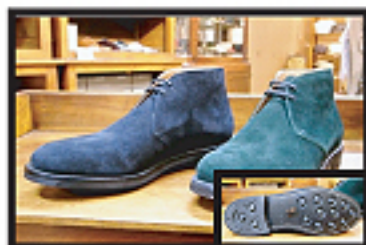
#81 Ryder & Ryder3 ウィズF

丸くボリュームのあるトゥが 特徴。カジュアルシューズに 使用される事が多く、昔からの 定番ラストという事もあり、 故多くのファンを魅了してきた。